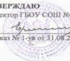
График проведения оценочных процедур в 2021-2022 учебном году